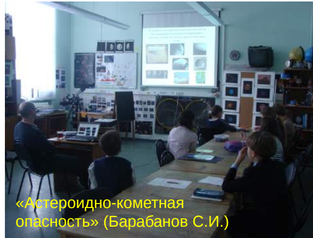
«Астероидно-кометная опасность» (Барabanов С.И.)