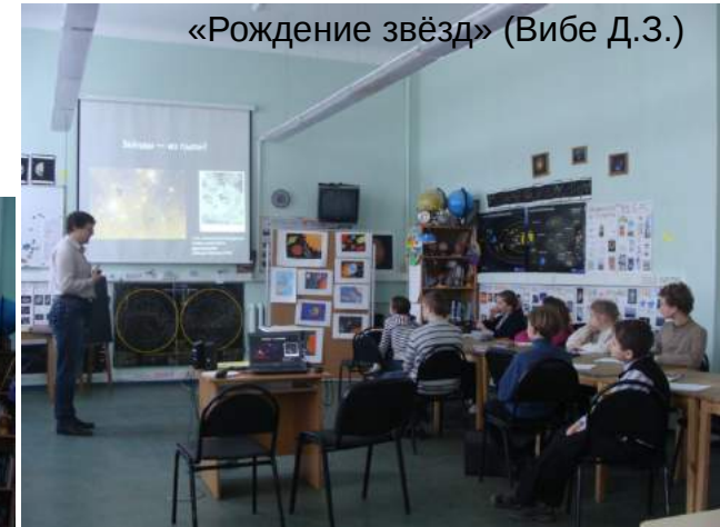
«Рождение звёзд» (Вибе Д.З.)