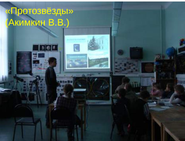
«Протозвёзды» (Акимкин В.В.)