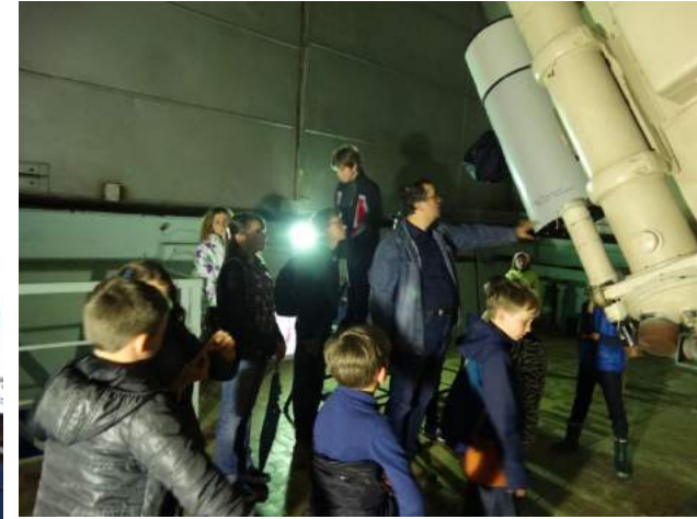
Телескоп ВАУ для наблюдения ИСЗ и космического мусора